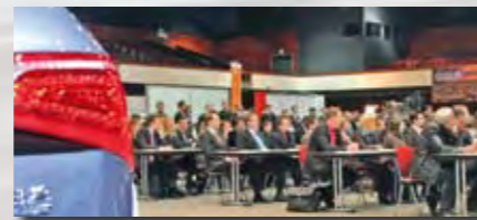
Blick ins Plenum, CAR-Symposium 2009

Thema: New Opel Carl-Peter Forster, President General Motors Europe und Aufsichtsratsvorsitzender Adam Opel AG