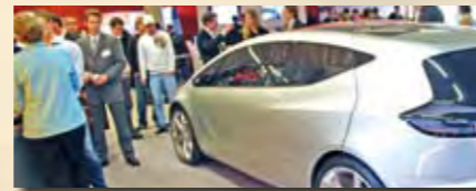
Impressionen Karriere-Tag 2009