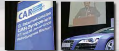
Impressionen CAR-Symposium 2009